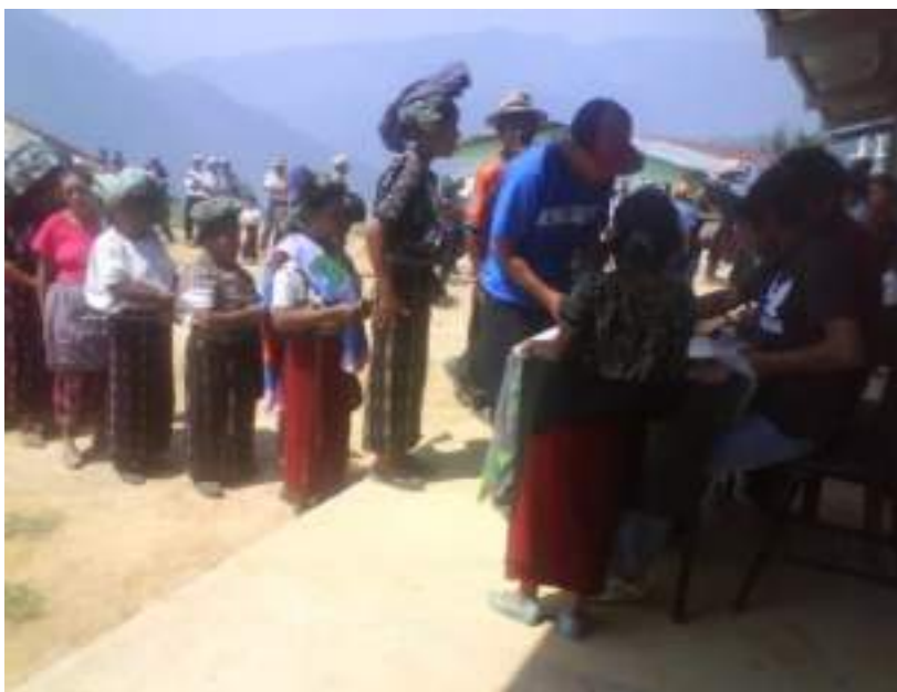
Participación de mujeres en consulta comunitaria para elegir junta directiva en el año 2009 a través de voto secreto

Debido a que la Ley guatemalteca no permite que los generadores de electricidad puedan vender la energía eléctrica a los consumidores directamente, pero si bajo la figura de auto-productores, fue necesario llegar a consensos para la conformación de una nueva organización que aglutinara como socios a personas de las tres comunidades como potenciales usuarios del servicio de energía eléctrica.