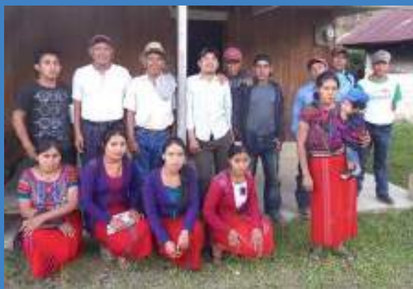
Hombres y mujeres capacitadas para el manejo y administración del Fondo de Microcrédito

con el objetivo de generar noticias vinculadas al proyecto de micro central hidroeléctrica Batzchocolá 1 ; c) Talleres con mujeres, a través del Proyecto de Equidad de Género del Ministerio de Energía y Minas, desarrollados por la Organización Latinoamericana de Energía (OLADE), con el fin de aprovechar la energía producida en las comunidades a través del desarrollo de proyectos productivos en beneficio de ellas; d) Intercambio de experiencias entre mujeres de cinco organizaciones locales que trabajan con proyectos comunitarios, con el apoyo de RED DE GENERO Y ENERGIA EN GUATEMALA, UICN/HIVOS, OLADE y e) diseño de un plan de capacitación y de constitución del fondo revolving para usos productivos de la energía que será administrado por la Unidad de la Mujer de ASHDINQUI, el cual está en proceso de implementación.