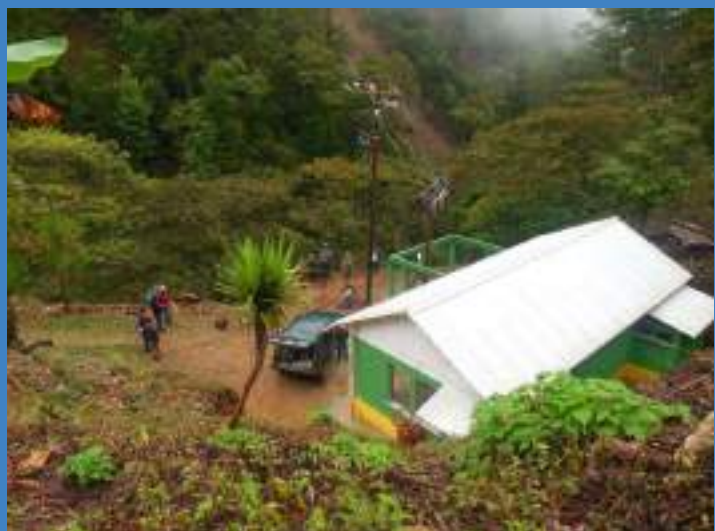
Vista aérea de la casa de máquinas de la micro central hidroeléctrica Batzchocola.

En el componente tecnológico , principalmente se realizó el diseño y fabricación de la turbina tipo Pelton de 90 KW; se elaboró el diseño final y rediseño de planos; construcción de obra civil: bocatoma, cámara de carga y tubería conducción y de presión; instalación de malla coanda como desarenador, tubería de conducción y de presión, casa de máquinas y subestación eléctrica; equipamiento de subestación y controles eléctricos; habilitación y protección del circuito hidráulico; protección de tubería; mejoramiento de seguridad y protección de casa de máquinas; diseño y construcción de redes de distribución en las tres comunidades; implementación de conexiones domiciliarias; construcción de carretera de acceso a casa de máquinas; y mejoramiento de carretera de acceso a la comunidad. Durante el desarrollo de la obra se realizó una gira de intercambio a la micro central de Chel, Chajul Quiché para conocer su funcionamiento.