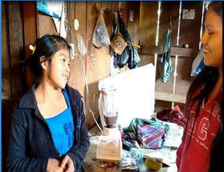
Utilización de licuadoras para elaboración rápida e higiénica de alimentos y preparación de néctares de frutas locales

• Situaciones asociadas con lo anterior, explican porque las mujeres hasta ahora no han participado dentro de la Junta Directiva de toda ASHDINQUI. Modificar mentalidades y prácticas es fundamental para ir rompiendo con estas barreras.