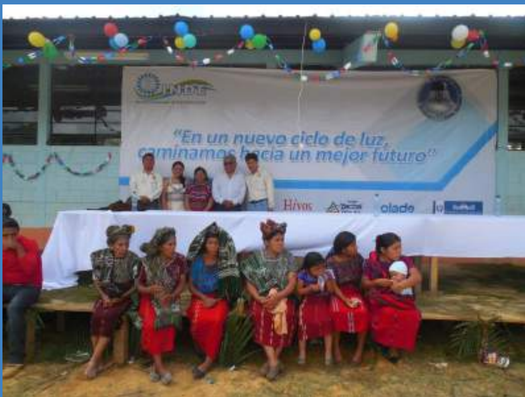
Una vista de la participación de mujeres en la inauguración de la MCH

“Es luz propia, luz de la comunidad, no de las grandes empresas.”