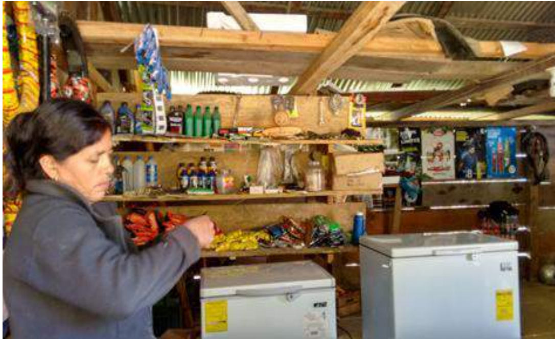
Tienda de productos básicos propiedad de asociada de ASHDIQNUI.

Cabe señalar que por la crisis económica y el tiempo relativamente corto del proyecto, son pocas las familias que han obtenido electrodomésticos y pocas las tiendas dotadas de refrigeradoras o congeladores.