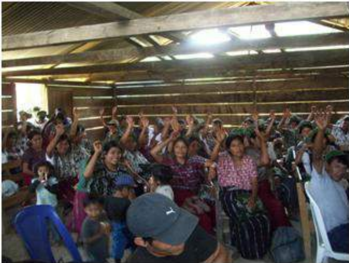
Mujeres y hombres de la comunidad ejerciendo su derecho al consentimiento libre, previo e informado

La encargada y lidereza de este componente es una mujer originaria del área y maya hablante Ixil, quien procede y conoce de su cultura y posee formación, habilidades y destrezas de la temática energética. Con lo cual se busca una mejor participación y comunicación entre mujeres y garantiza mayor pertinencia en las acciones que Semilla de Sol implementa con las comunidades y en especial con las mujeres.