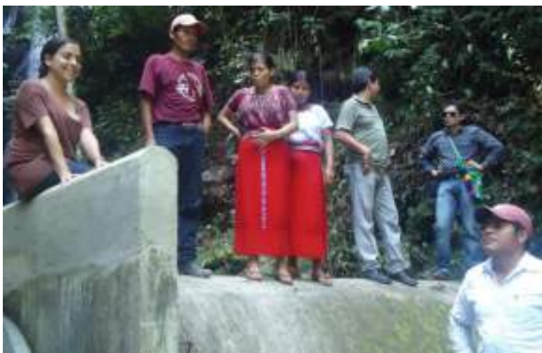
Visita de HIVOS al proyecto y a la comunidad

El establecimiento de una sociedad horizontal entre Semilla de Sol y ASHDINQUI, permitió ensayar relaciones diferentes de acompañamiento, de cogestión y de desarrollo mutuo de capacidades organizativas, ha permitido una formación y entrenamiento en servicio, bajo el método de “aprender haciendo”, rompiendo los esquemas tradicionales de paternalismo y autoritarismo que se reproducen en los procesos para impulsar el desarrollo comunitario.