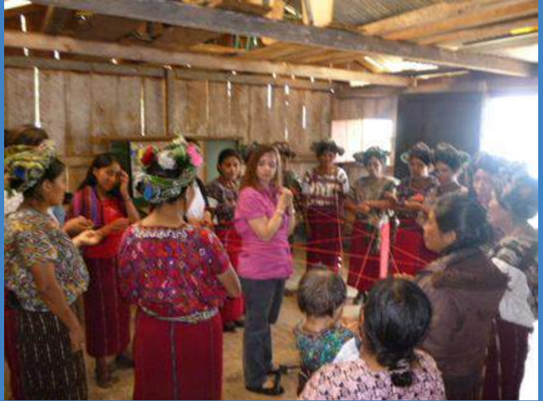
Taller de género y liderazgo impartido por OLADE y Unidad de Género del MEM del gobierno de Guatemala

Es importante señalar, que las mujeres se han apropiado de la valoración de su participación en la construcción del proyecto, porque para que los hombres pudieran ocuparse en tareas requeridas por la MCH, a ellas les tocó hacer trabajos que normalmente estaban asignados a los hombres, por ejemplo: siembras y cosechas. Ellas dicen “a nosotras también nos costó” . Hay una conciencia y una valoración de este trabajo por parte de ellas y de muchos hombres.