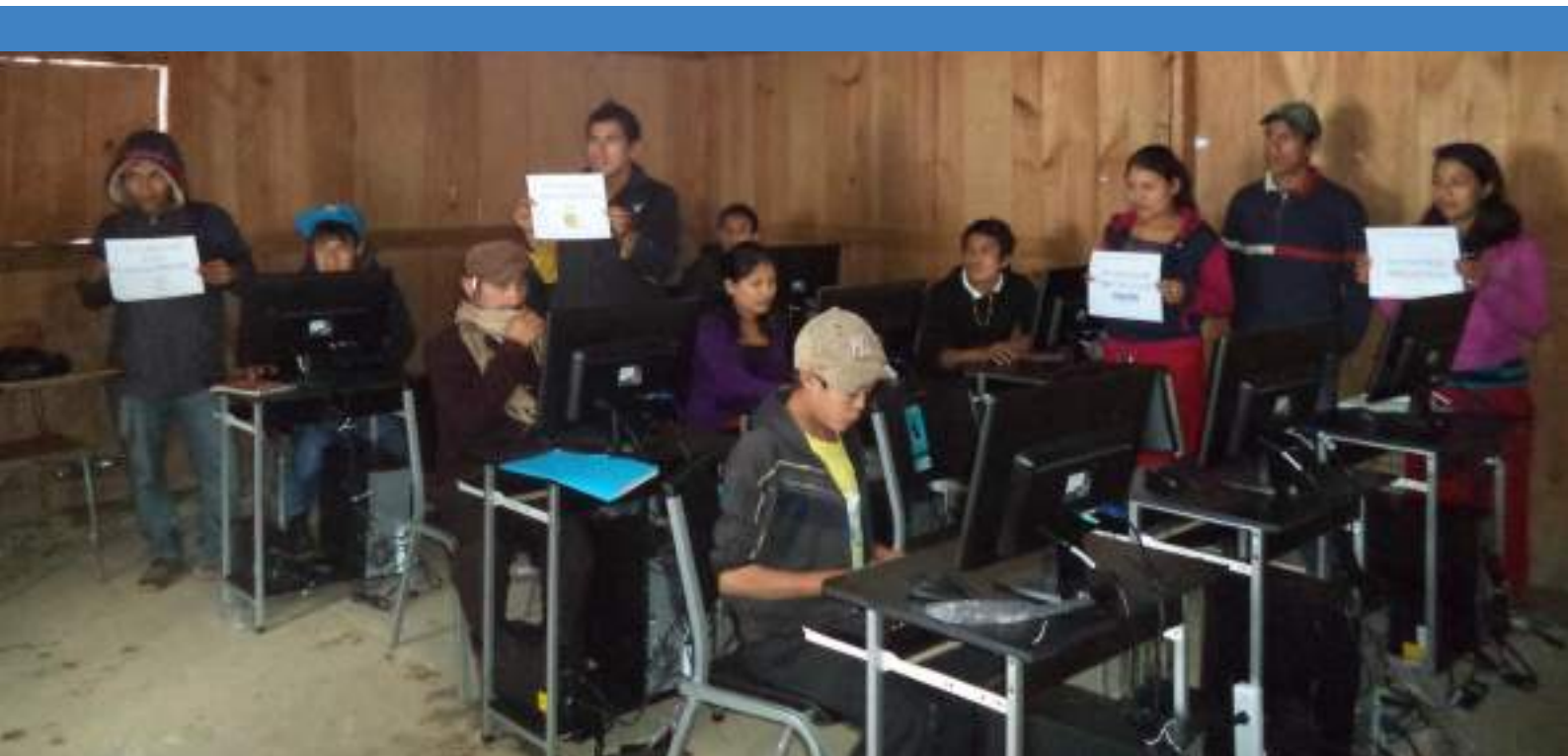
Capacitación en el Centro Tecnológico intercultural con participación de jóvenes (hombres y mujeres)

En el marco del proyecto se crearon dos equipos paritarios de hombres y mujeres como encargados de temas de comunicación social y computación. Esta acción, permite aprovechar los conocimientos y energía que ya tienen, así como crear nuevas capacidades técnicas y forjar nuevos liderazgos locales.